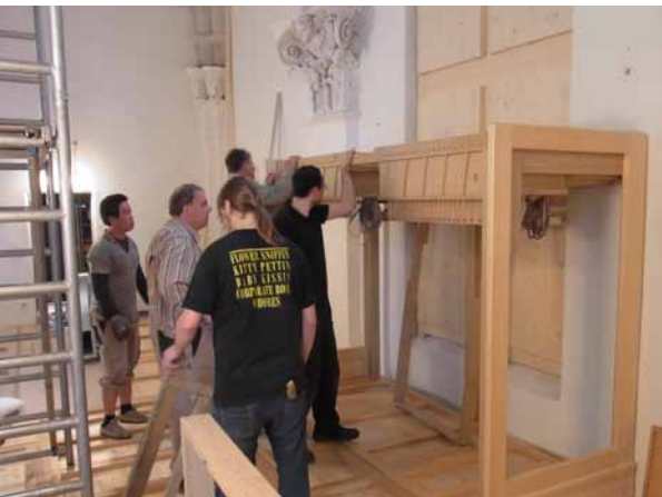
Der Aufbau der Orgel beginnt

Holz wurde auch für die großen und tiefen Basspfeifen verwendet, da sie eine ausgeprägtere Grundtonbildung aufweisen.