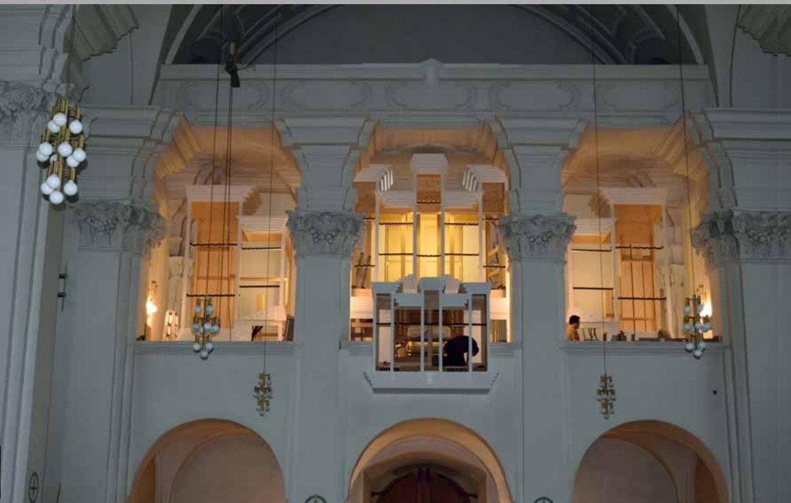
Der Intonateur bei der Arbeit