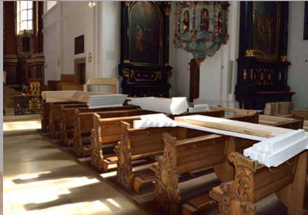
Dem Hauptwerk wird die Krone aufgesetzt