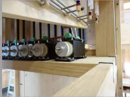
Schleifenzugmagnete der Registerschaltung

Von lat. „prospicere“ = anschauen, betrachten; das, was man vom Kirchenraum aus von der Orgel sieht. Das „Gesicht“ der Orgel; sollte stilistisch dem Kirchenraum angepasst sein, aber auch zum Werkaufbau der Orgel einen Bezug haben.