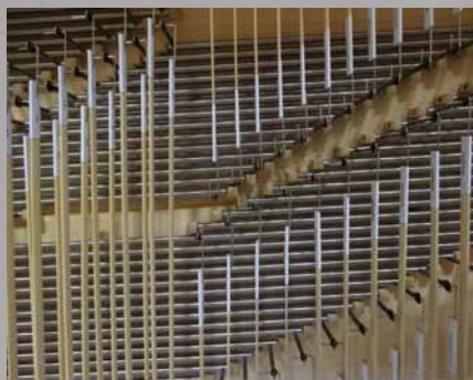
Detailansicht der Traktur – das Wellenbrett