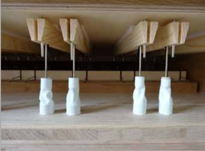
Ventile in der Windlade

Rechteckiger, luftdichter Holzkasten, der durch „Schiebe“ (Trennwände) parallel zur Schmalseite in 56 Tonkzellen geteilt wird (56 Töne im Manual, 30 im Pedal). Parallel zur Längsseite stehen die Pfeifen eines Tones. Der Wind (komprimierte Luft) wird in der Lade durch die Spielventile und Registerzüge auf die gewünschten Pfeifen verteilt.