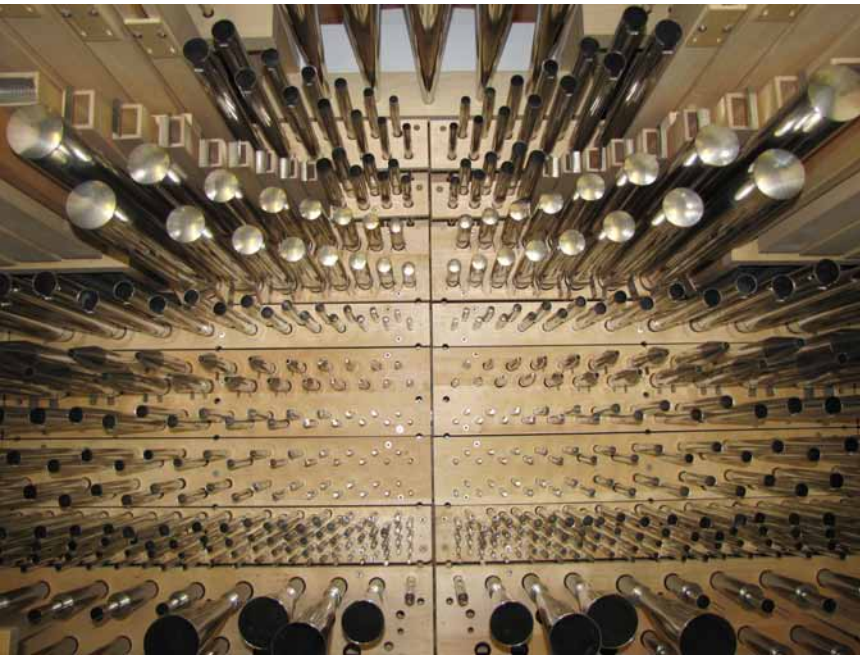
Blick auf die Hauptwerks- windlade

der Orgelbauförderverein und die Franziskanergemeinschaft Weggental