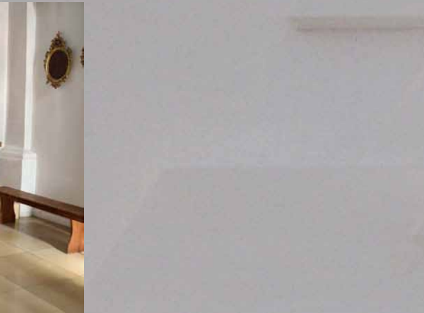
Die Bodenplatte ist ausgerichtet